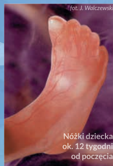
Nóżki dziecka ok. 12 tygodni od poczęcia