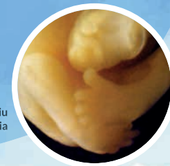
Nóżki dziecka w 7. tygodniu od poczęcia