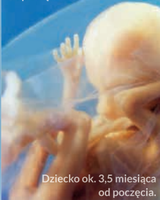
Dziecko ok. 3,5 miesiąca od poczęcia.