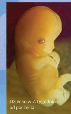
Dziecko w 7. tygodniu od poczęcia