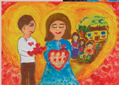
autor: Adam Emerita