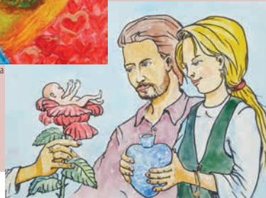
autor: Julia Strumińska