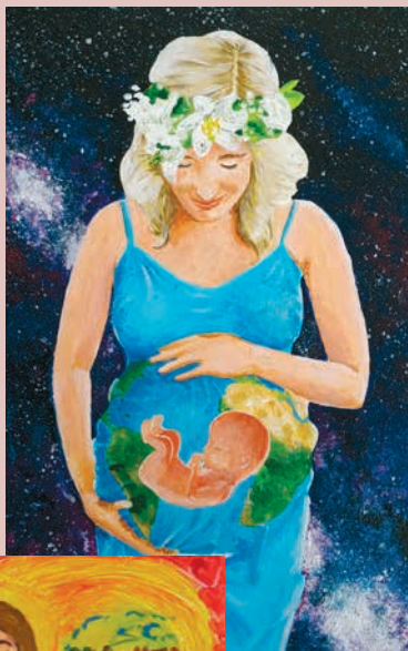
autor: Jan Kałużny